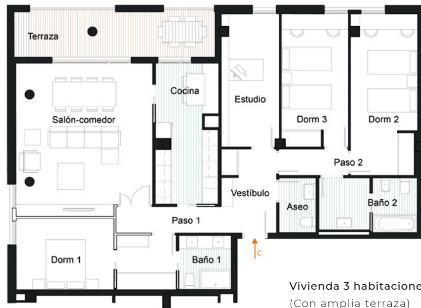
Vivienda 3 habitaciones (Con amplia terraza)

CUIDAMOS CADA DETALLE, PARA LOGRAR EL MÁXIMO APROVECHAMIENTO Y FUNCIONALIDAD.