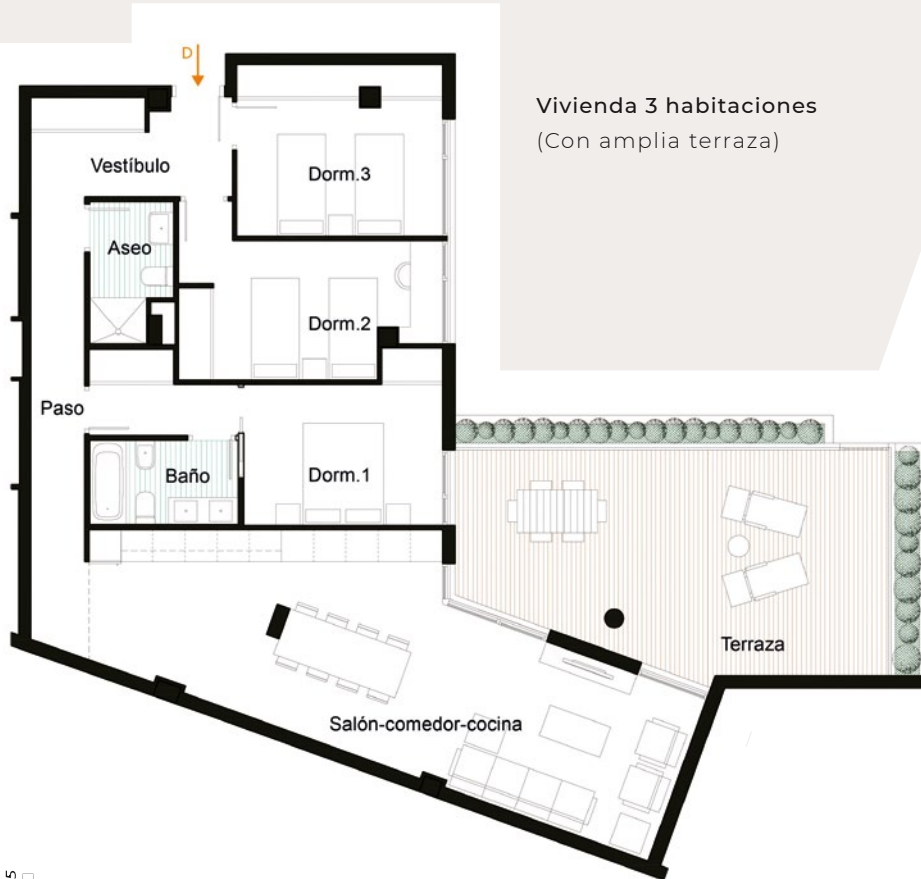
Vivienda 3 habitaciones (Con amplia terraza)